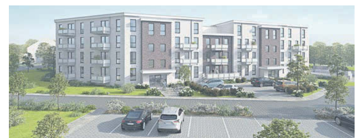
Hier wird das „Seniorenwohnen mit Konzept“ verwirklicht

Was ist anders? Jeder kann für sich leben und so viel Kontakt zu seinen Nachbarn pflegen wie er möchte. Das Konzept, dass die Bewohner aus der gleichen Generation stammen und ggf. auch ähnliche Interessen haben, erleichtert die Bildung einer harmonischen Nachbarschaft. Ganz nach dem Motto: Für sich leben, aber nicht einsam sein.“