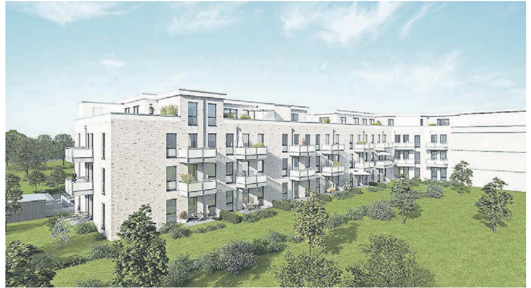
So soll das Gebäude am Ende aussehen. Die Fertigstellung ist für Ende 2020 geplant.

1922 wurden auf dem Gelände drei Häuser für Bahnbedienstete gebaut, die so in unmittelbarer Nähe zum Meckelfelder Bahnhof ein Zuhause fanden. Kinder nutzten die verschneite Zufahrt zu den Bahnhäusern als Rodelbahn. Später campierte hier dann auch der Zirkus. Lustige Clowns, Artisten aus aller Welt, spektakuläre Zirkusvorstellungen - regelmäßig hieß es hier „Manege frei“. Dadurch hat das Grundstück auch seinen Namen bekommen. Doch der Zirkus zog